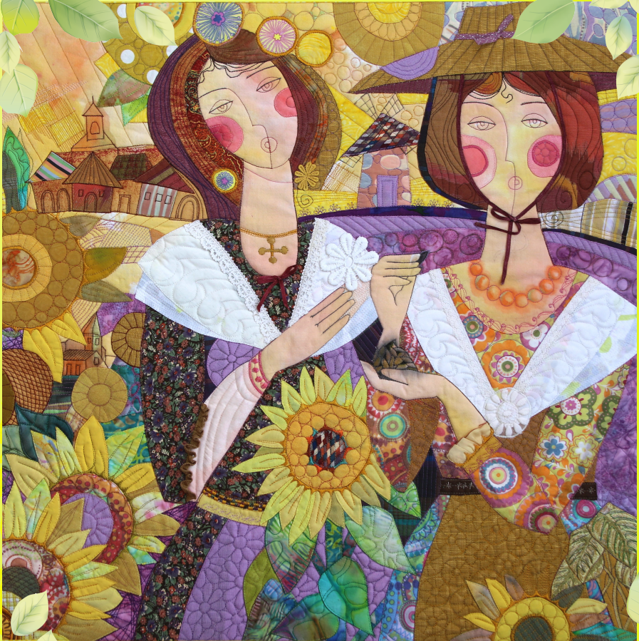
Femmes de Provence - Galla Grotto - 2017